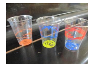
ペンで色を付けたら…