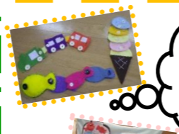
みんなで 一緒に 遊ぼう!!