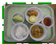
ごはんも おいしいよ